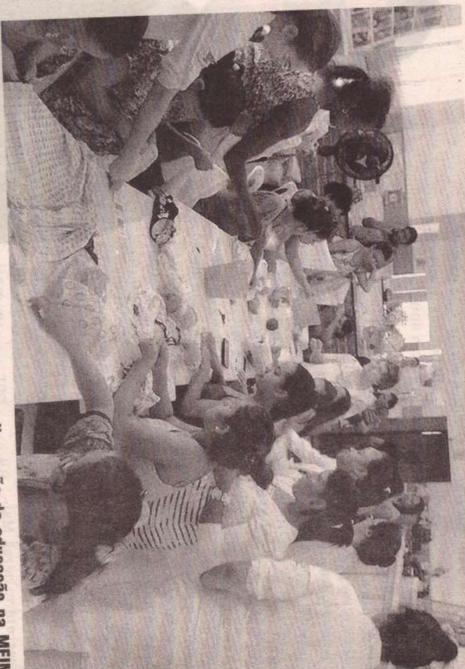
Mês do Diabetes: Associação dos Diabéticos realiza ação de educação na MEIMEL

A programação em alusão ao Dia Mundial do Diabetes segue no dia 14 de novembro (quarta-feira), Dia Mundial do Diabetes, com uma atividade pública, no período da manhã, Terminal Urbano. No dia 24 de novembro (sábado), haverá atividade do Grupo de Pais, na Casa da Criança e no dia 27 de novembro (terça-feira), haverá atividade de Grupo do Jardim Europa. Os encontros serão a partir das 14h e com apoio da Etec Prof. Dr. José Dagnoni.